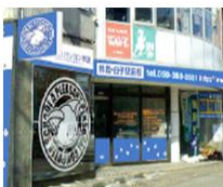
鈴鹿・白子駅前教室