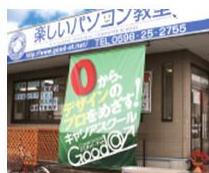
松阪・駅部田教室