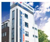
伊勢・ララパーク前教室